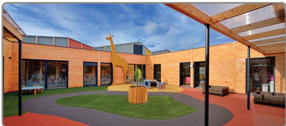
Patio central de la crèche de Narbonne

Crédit photo : Pascale Defayet, architecte