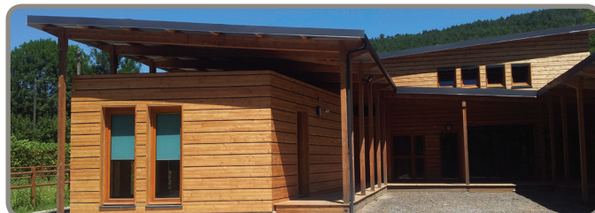
Salle Piboulis à Sainte-Croix Vallée Française (Lozère)

Les Communes forestières accompagnent à chaque étape le Maître d'Ouvrage pour garantir un projet utilisant du bois local. Des modèles de documents, des méthodes détaillées et un accompagnement de l'équipe de Maîtrise d'Œuvre et des entreprises est effectué tout au long du projet.